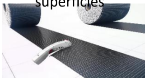
Cortar la tela