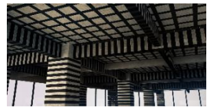
Curar y proteger