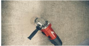
Tratamiento de superficies