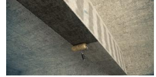
Aplicación de adhesivo